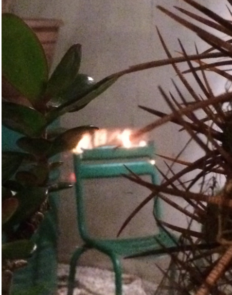
HOËL DURET. UN CONFORT SANS FIN . 2015. © HOËL DURET