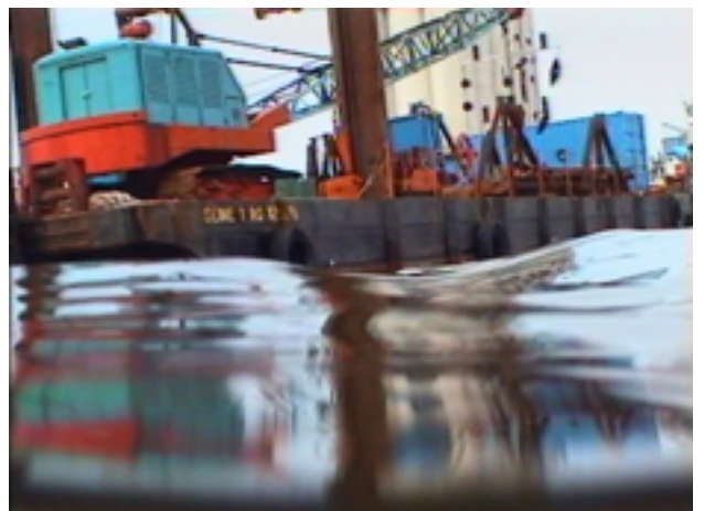
Flottaisons, 2000 vidéo, couleur, son, 30 min. 30, Collection Frac Bretagne.