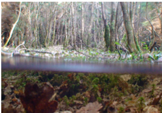
Sources, 2009 vidéo, couleur, son.