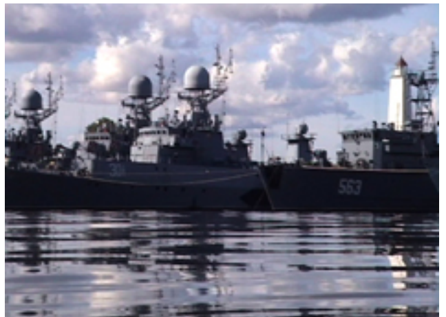
Kronstadt, 2004 vidéo, couleur, son, boucle de 20 sec.