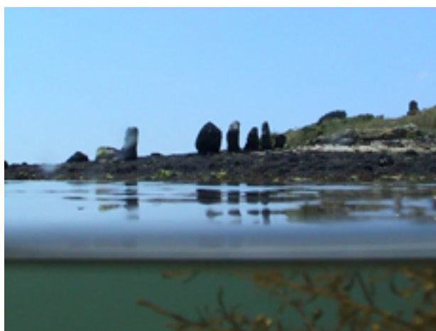
Er Lannic, 2006 vidéo, couleur, son, 26 sec.