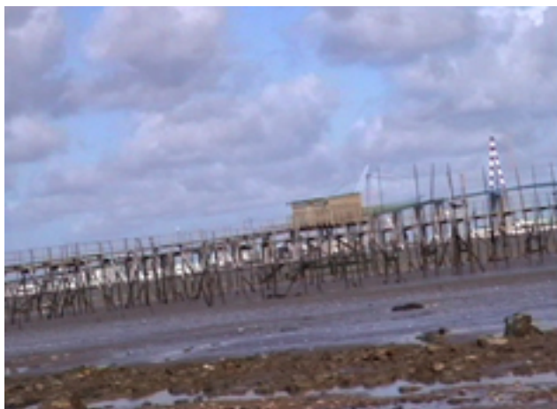
La Loire, 2002 vidéo, couleur, son, 2 min. 01.