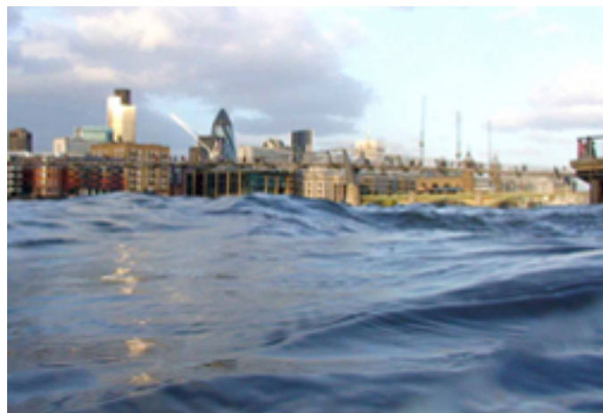
Fleuves, 2008 Installation de 5 vidéos, couleur, son.