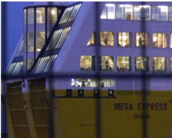
Ferry à Bastia, 2006 vidéo, couleur, son, 1 min. 57.