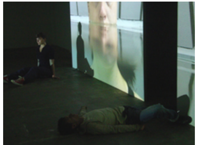
Les Danseurs immobiles, 2006

Vues de l'exposition, La Criée centre d'art contemporain, Ville de Rennes