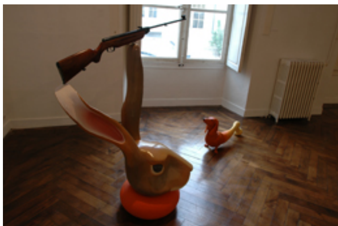
Vues de l'exposition L'Hallali sonne, Ecole d'arts plastiques, Châtelleraut, 2005.