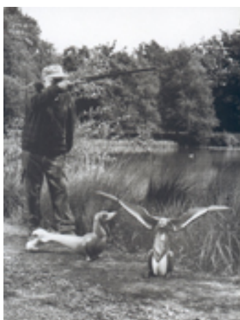
Baignade interdite (épisode du Tango des Espèces), 1998

Le tango des espèces, série les animaux nous consolent