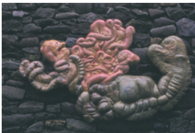
Paysages intérieurs, 1974

Matériaux : résine polyester et fibre de verre