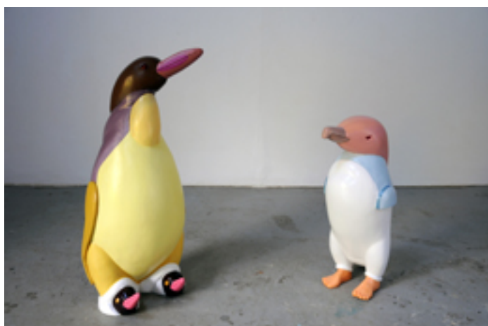
Chaud devant, noir autour

Le tango des espèces, série Le chaud et l'effroi.