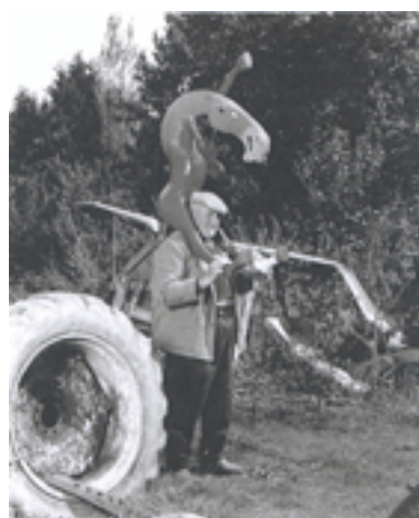
Reportage pur beurre, 2004

Extraits du Livre : photographies en noir et blanc, Edition Frac Bretagne - Galerie du TNB.