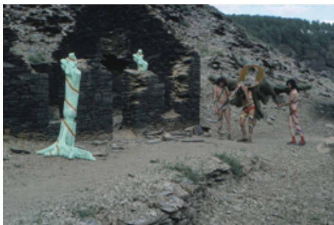
Promenade d'artifice, 1975

Nuit de la performance, Biennale de Paris, Musée d'art moderne de la ville de Paris, 1980