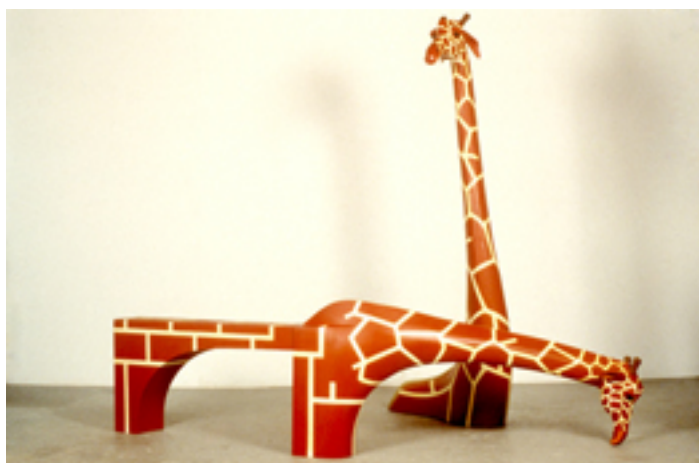
La soif des uns fissure les autres, 1992

Le tango des espèces, série Le chant des naufragés. Collection Frac Bretagne