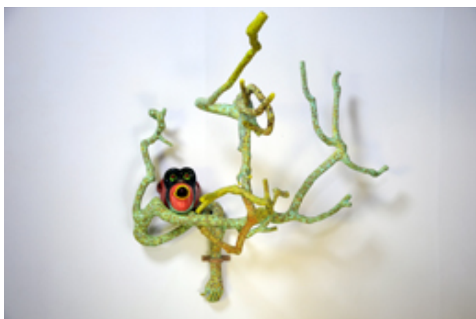
A corps perdu

Le tango des espèces, série Le chaud et l'effroi.